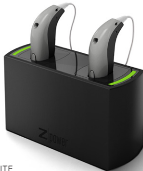
Wiederaufladbares Zerena miniRITE in der Ladestation